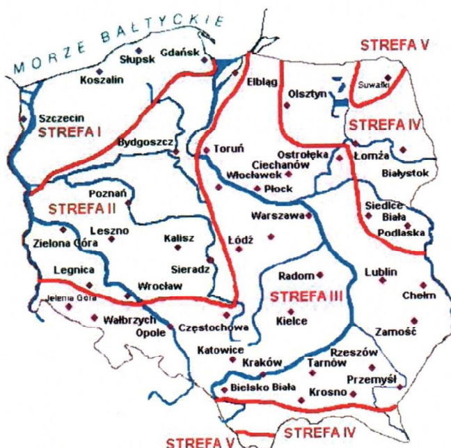
Rys. 1 Strefy klimatyczne Polski i temperatury obliczeniowe

Położenie obiektu, w którym planowany jest montaż, na mapie ma wpływ na pracę instalacji. W zależności od współrzędnych geograficznych rozbieżności w temperaturach projektowych mogą mieć znaczącą wartość. W skali kraju ilustruje to poniższa mapa (Rys.1).